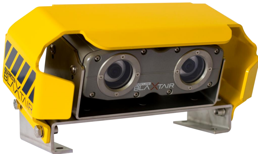
Figure 1 Tête du Blaxtair

Blaxtair est un système embarqué de détection d'obstacles et de piétons pour engins industriels.