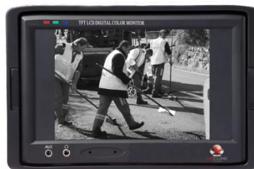
Figure 2 Unité de calcul et écran 7".